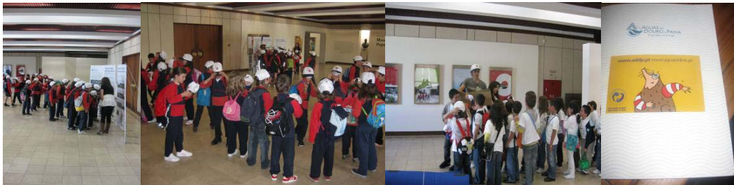
Dinâmica das actividades e visita à exposição dos trabalhos