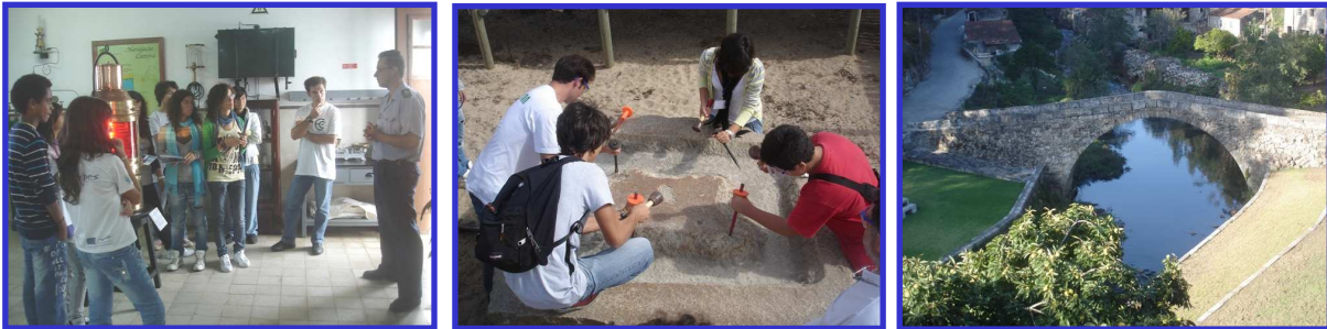
Fig. 9, 10 e 11 - Visita ao Farol de Matosinhos e Casa do Mar em Matosinhos