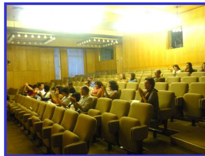
Fig. 5 - Auditório principal onde decorreram as Jornadas (ESB-UCP)