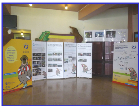
Fig. 1 - Stand da AdDP sobre o Projecto Integrado Mil Escolas

( http://www.aguaonline.net/ ), a Câmara Municipal de Valongo, a Lipor, a FNAJ, o IPJ, a ARH norte, os Ecoclubes, o Movimento Protejo, o Movimento em Defesa do Rio Tinto, o Grupo do projecto Rios da Silva Escura e o Centro Regional do Porto da UCP.