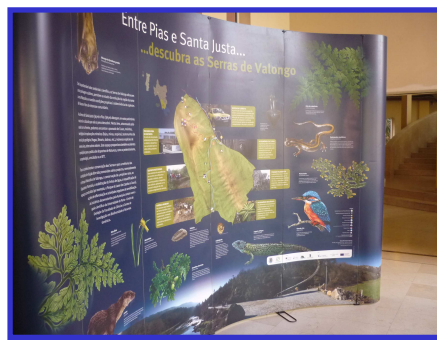
Fig. 2 - Stand da Câmara Municipal de Valongo sobre as Serras de Valongo

Durante os dois dias de Jornadas, estiveram expostos vinte e dois trabalhos dos participantes, de Norte a Sul de Portugal, do Concurso de fotografia “Denúncia de troços de rios e praias poluídas”.