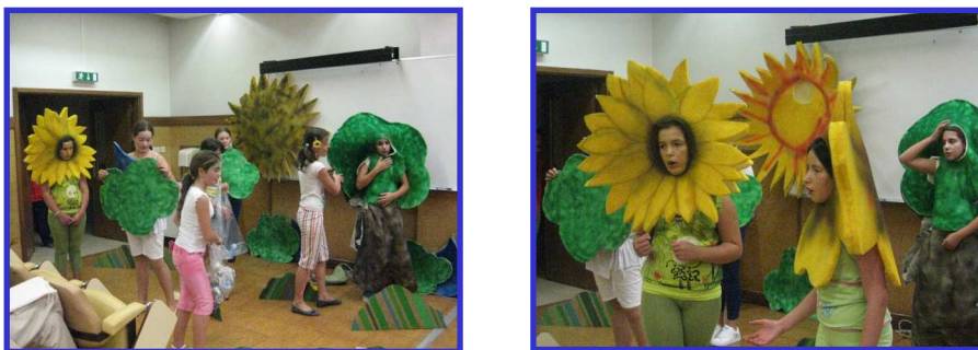
Fig. 6, 7 - Apresentação artística de jovens da Escola de Escariz " Floresta d'água"

Inserido neste painel houve a apresentação sobre o Rio Arda e uma peça de teatro intitulada "Floresta d'água", dinamizada por 13 alunos da EB 2, 3 de Escariz, Arouca, com o apoio das suas professoras. O trabalho apresentado bem como a peça de teatro resultam de um Projecto de 2 anos lectivos, período 2007/2009, Projecto Mil Escolas promovido pelas AdDP em que a escola foi vencedora do concurso (num total 15 escolas seleccionadas).