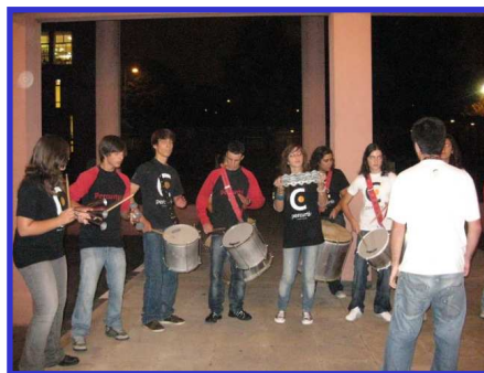
Fig. 8 – Encerramento do 1º dia de Jornadas: actuação dos Per'Curtir

O primeiro e intenso dia das jornadas terminou com a actuação do grupo de percussão os de Mindelo - Per'Curtir.