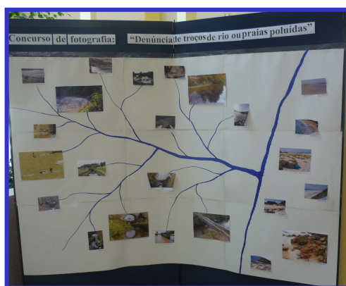
Fig. 3 - Trabalhos dos participantes do Concurso de fotografia

Durante os dois dias de Jornadas, estiveram expostos vinte e dois trabalhos dos participantes, de Norte a Sul de Portugal, do Concurso de fotografia “Denúncia de troços de rios e praias poluídas”.