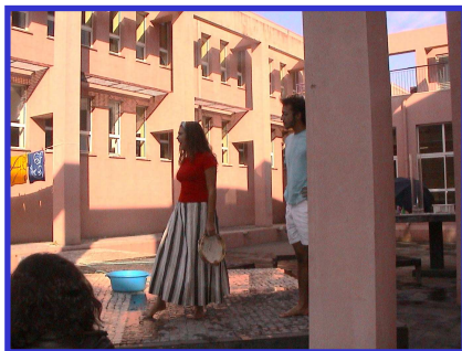
Fig. 4 – Abertura das Jornadas: Teatro Elástico em actuação

Dando as boas vindas, cada representante falou do papel da sua organização e da importância da colaboração, entre todos (entidades, indivíduos, ...), para alcançar a sustentabilidade.