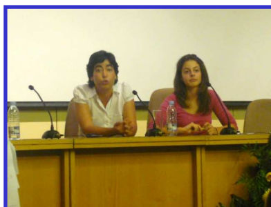
Fig. 12 – Encerramento das Jornadas